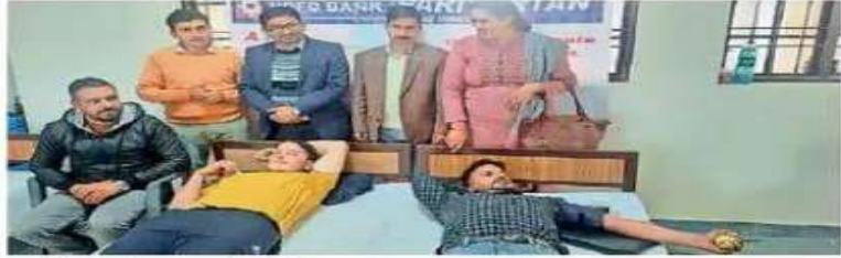
करसोग महाविद्यालय में आयोजित हुआ रक्तदान शिविर।

रक्तदान शिविर में रोवर रेंजर इकाई, नेशनल कैडेट कोर, राष्ट्रीय सेवा योजना, रेड रिबन क्लब, जूनीजी सोसाइटी सब्जेक्ट सोसाइटी के छात्रों, क्लब के