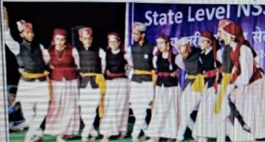
शिविर का समापन

करसोग कालेज में मेगा शिविर का समापन, 70 कालेजों से आए 300 छात्रों ने लिया हिस्सा