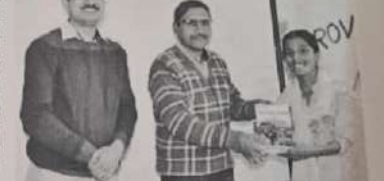
करसोग कॉलेज में आयोजित प्रतियोगिता में पुरस्कार प्राप्त करती छात्रा।