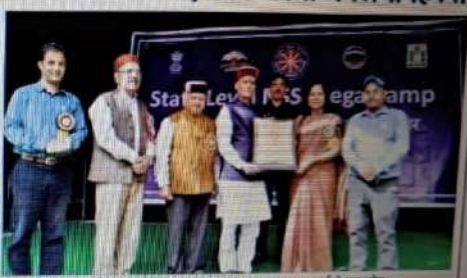
शिविर का समापन

करसोग कालेज में एनएसएस कैंप का समापन कार्यक्रम हुआ। छात्रों ने सांस्कृतिक प्रदर्शन किया।