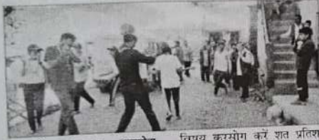
कार्यालय संवाददाता - कटसोग

शनिवार को स्वीप कार्यक्रम के अंतर्गत राजकीय महाविद्यालय के रोवर रेंजर इकाई के छात्रों ने महोग, आशला, सराहन, तेवन, कोटल, गांव में लोगों को जागरूक करने के लिए नुक्कड़-नाटक का मंचन किया, जिसका