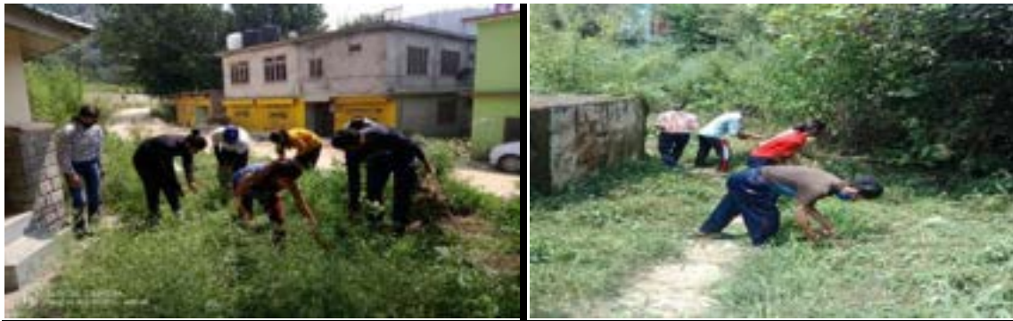
Photographs of the Day-V