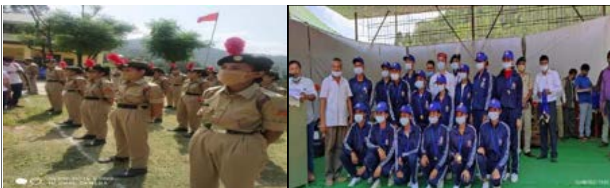
Photographs of the Day-VII