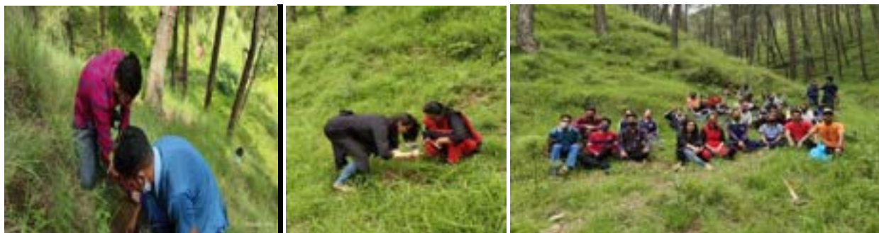
Photographs of the Day-VI