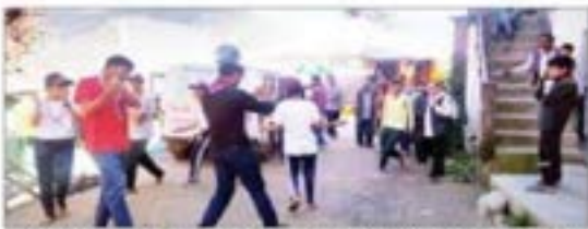
कार्यालय संवाददाता – करसोग

स्वीप कार्यक्रम के तहत रोवर रेंजर इकाई के छात्रों ने जागरूक किए लोग