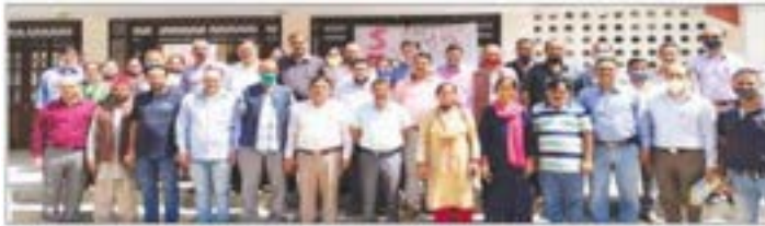
करसोग कॉलेज में अभिभावक-अध्यापक संघ की नई कार्यकारिणी।