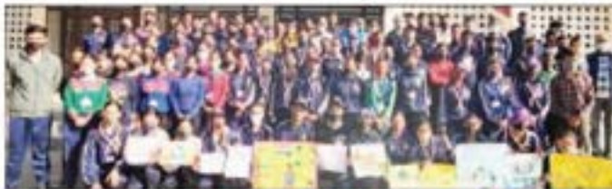
विजयन दसक। करसोग

करसोग कॉलेज में सांप्रदायिक सदभाव सप्ताह का समापन