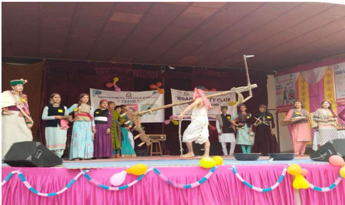
TRADITIONAL MODELING COMPETITION ON THEME - "BEAUTIFUL NATION WITH VIBRANT COLORFUL ATTIRES" DURING MEGA FEST