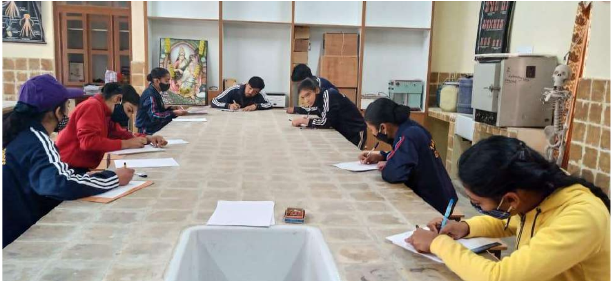
ESSAY WRITING COMPETITION ON THEME - "SADAK SURAKSHA JEEVAN RAKSHA" DURING MEGA FEST