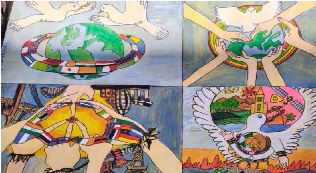
PAINTING COMPETITION ON THEME - "PEACE -THE NEED OF THE HOUR" DURING MEGA FEST