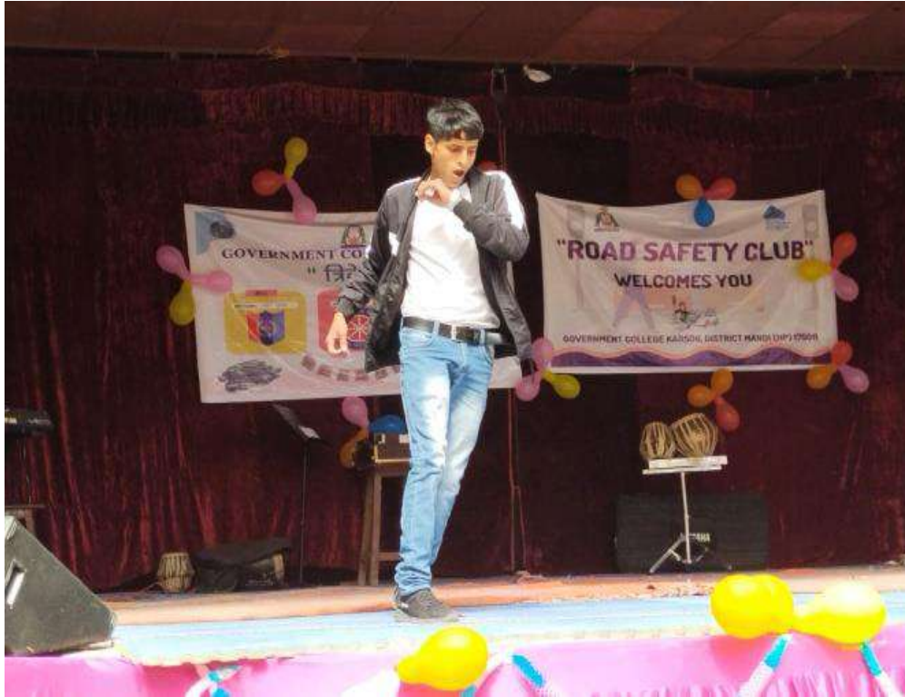
DANCE COMPETITION ON THEME - "CULTURAL HERITAGE" DURING MEGA FEST