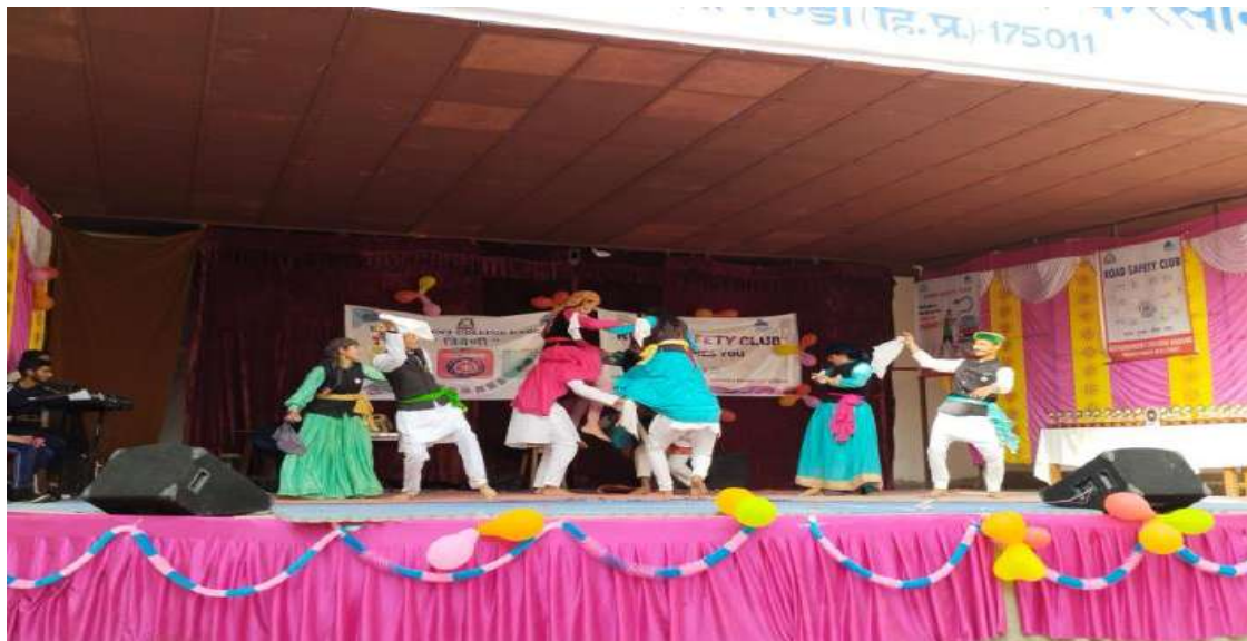
DANCE COMPETITION ON THEME - "UNITY IN DIVERSITY" DURING MEGA FEST