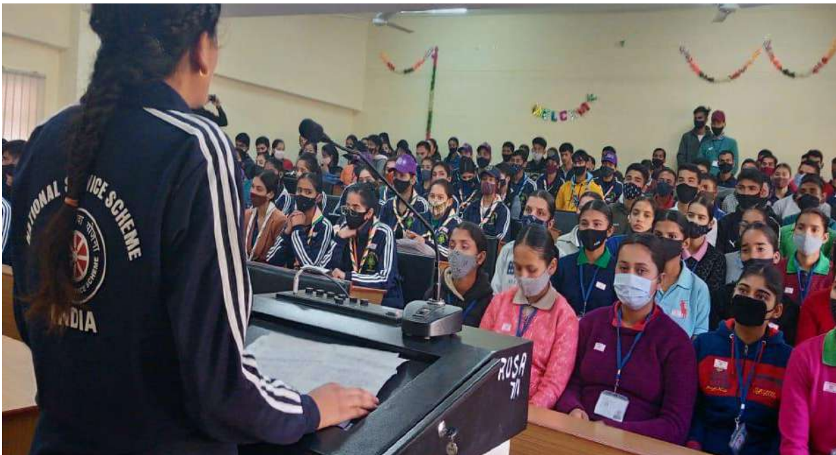
DECLAMATION CONTEST ON THEME - "MORAL VALUES AND TODAY'S GENERATION" DURING MEGA FEST