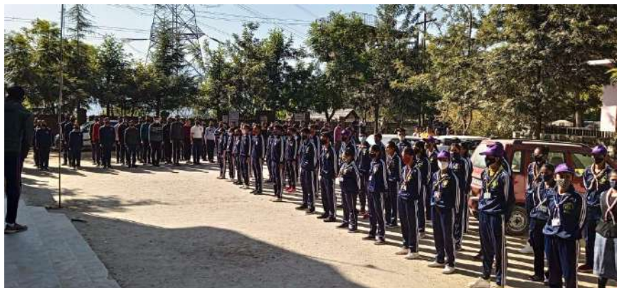
“National Flag Hosting ceremony” in college campus during the mega event