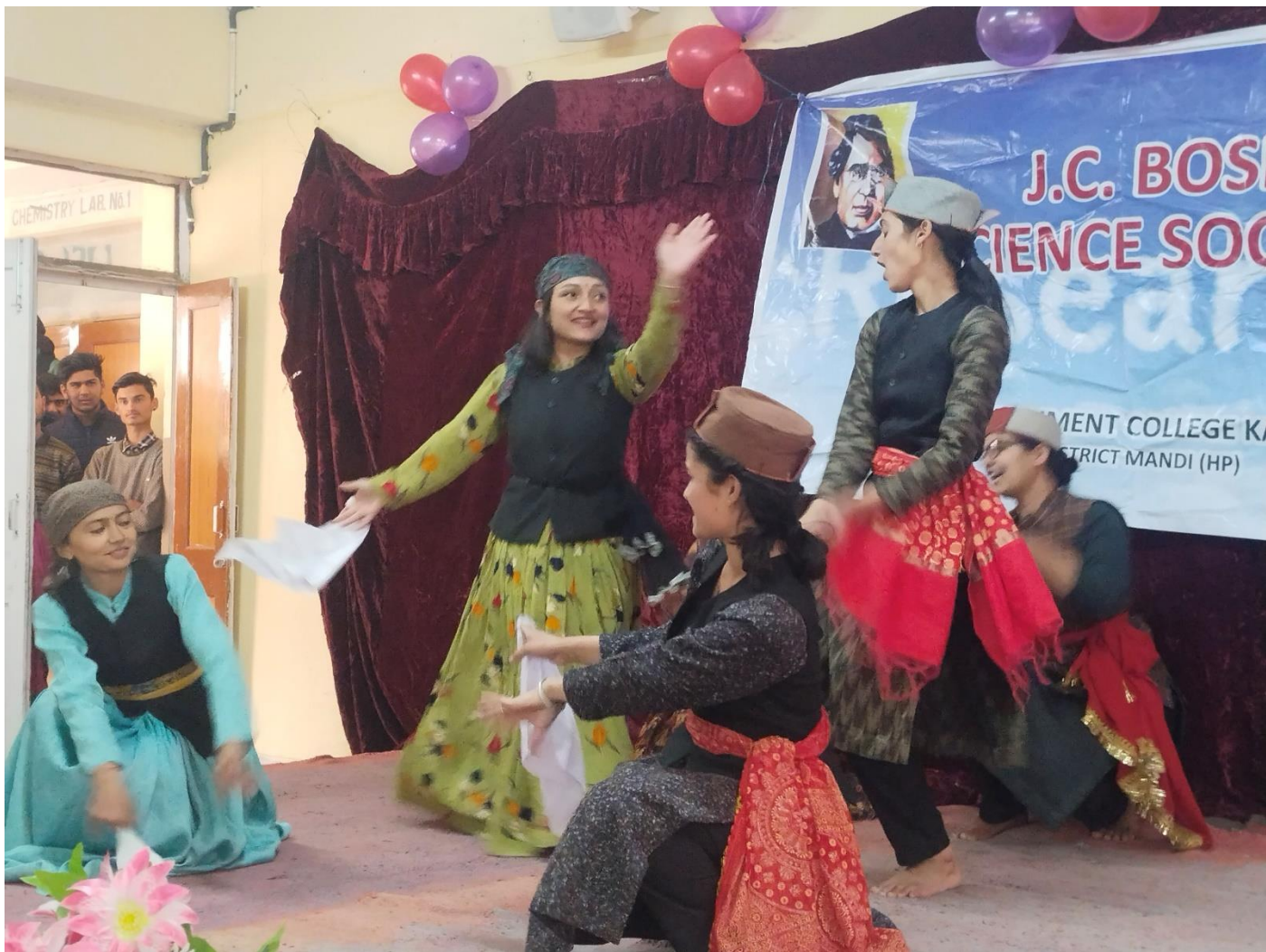
Folk Dance Competition in progress during J. C. Bose. Science Society Function