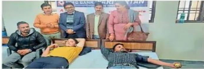
करसोग महाविद्यालय में आयोजित हुआ रक्तदान शिविर।

रक्तदान शिविर में रोवर रेंजर इकाई, नेशनल कैडेट कोर, राष्ट्रीय सेवा योजना, रेड रिबन क्लब, जूलॉजी सोसाइटी सब्जेक्ट सोसाइटी के छात्रों, क्लब के