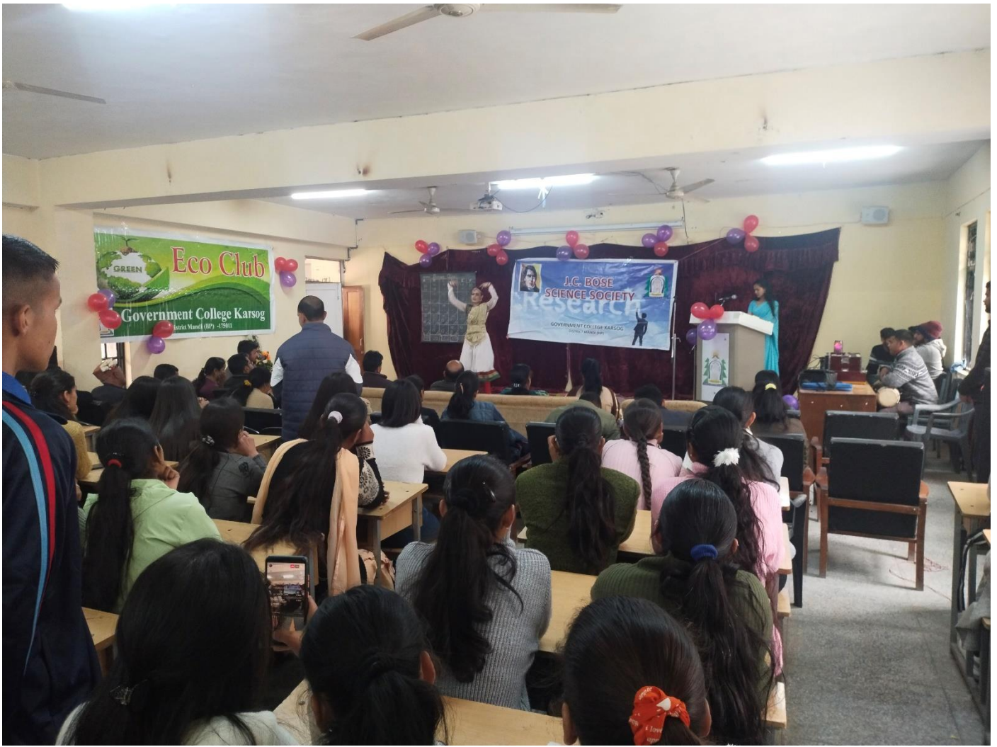
Classical Sola dance performance in J.C. Bose. Science Society Function