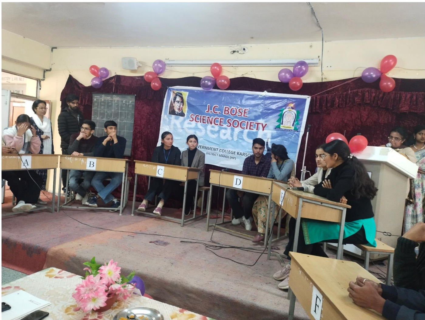
Quiz competition in progress on National Science Day-2023