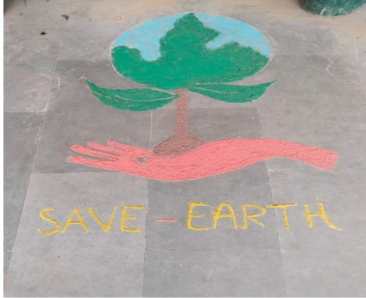
Rangolis on theme- "Save Earth" made by participants on J. C. Bose Science Society Function

News Coverage on Premiere Newspaper of North India- Divya Himachal on 28-02-2023(Digital copy)