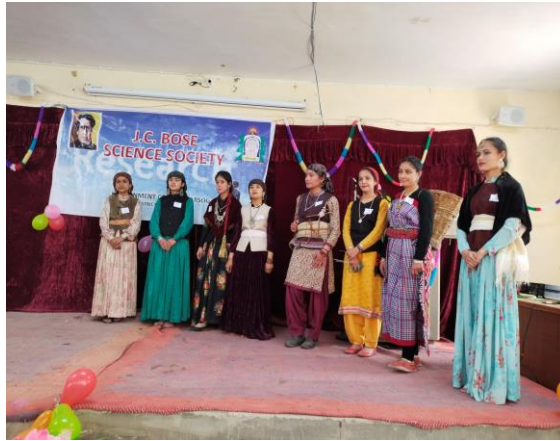
Participant of Folk Dress Competition