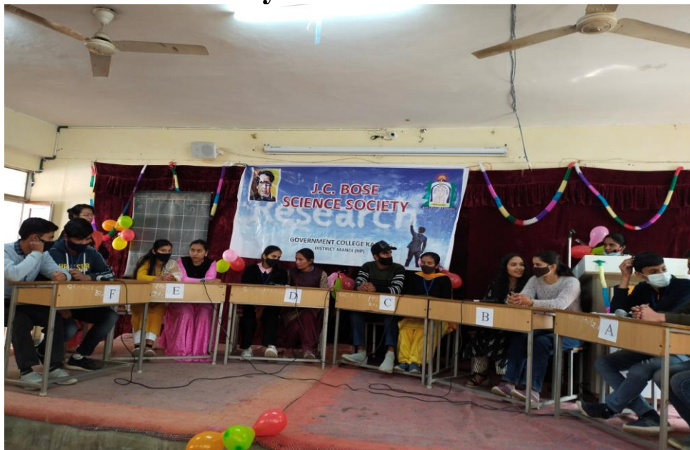
Photograph of Quiz Competition