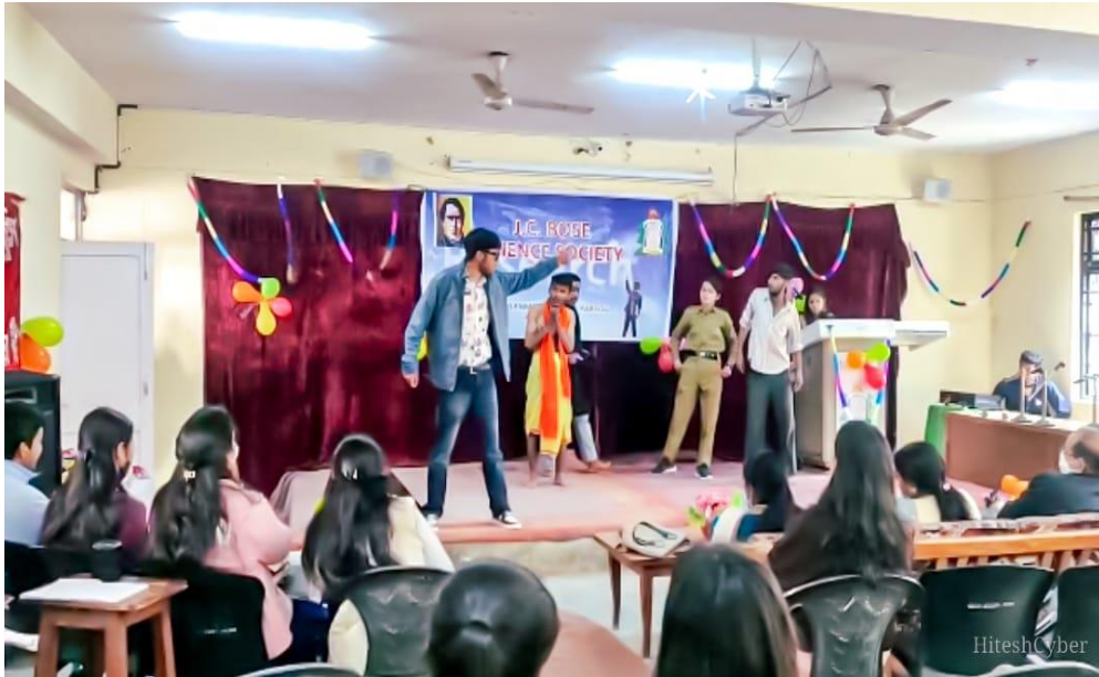
Photograph of skit Competition