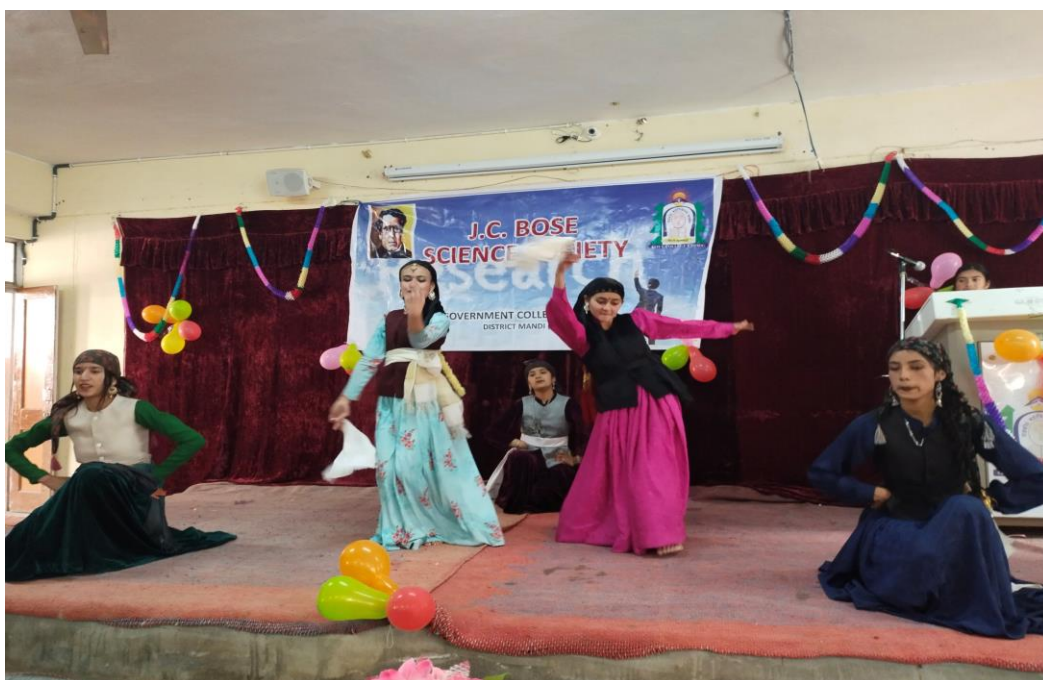
Photograph of Folk Dance Competition