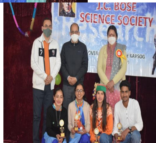
Prize winners were felicitated by worthy Principal During closing ceremony of the mega event