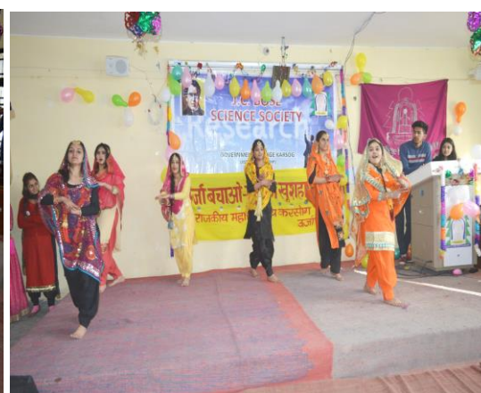
Science Students performing cultural activities during the J.C. Bose. Society function held on dated 17-03-2018.