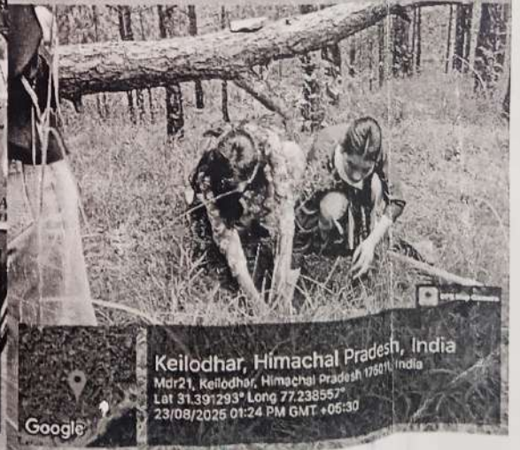
Keilodhar, Himachal Pradesh, India Mdr21, Keilodhar, Himachal Pradesh 175011, India Lat 31.391293° Long 77.238557° 23/08/2025 01:24 PM GMT +05:30