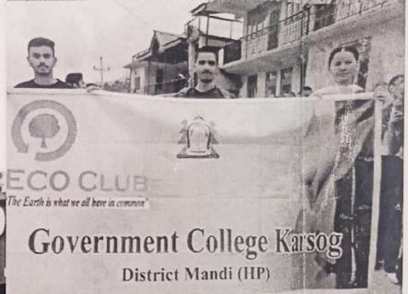
Government College Karsog District Mandi (HP)