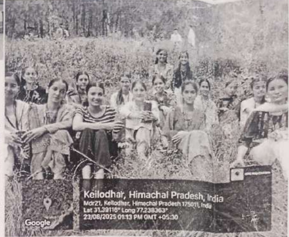
Keilodhar, Himachal Pradesh, India Mdr21, Keilodhar, Himachal Pradesh 175011, India Lat 31.39116° Long 77.238363° 23/08/2025 01:13 PM GMT +05:30